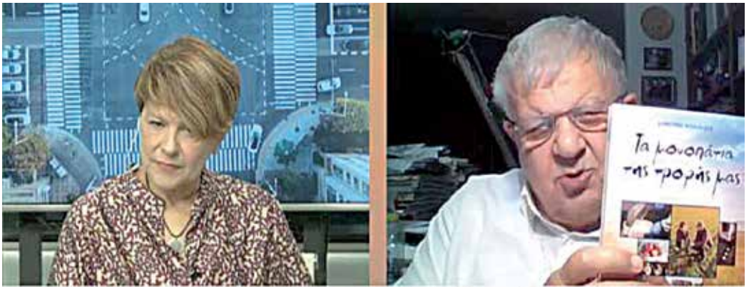
«Τα μονοπάτια της τροφής μας» στο Βυζίκι Δήμου Γορτυνίας Αρκαδίας και το 45 ο Φεστιβάλ Άκοβας