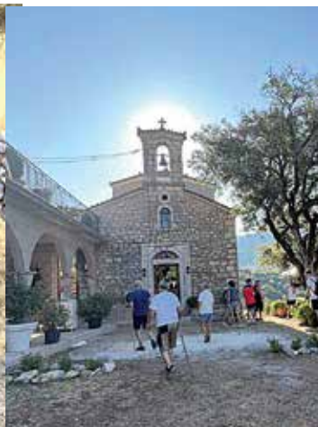
Πεζοπόροι κατά την επιστροφή τους στη Δεξαμενή