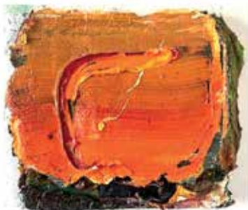
Distance Matter (ή Mater) Πρώτη ατομική έκθεση ζωγραφικής Γκαλερί «Έκφραση» - Βαλαωρίτου 9 Α - 2103607598 Εισόδος ελεύθερη - Μέχρι 26 Οκτωβρίου 2024 Τρ.-Πέμ.-Παρ.: 12-8 μ.μ., Τετ.: 12-6 μ.μ., Σάβ.: 12-3 μ.μ.